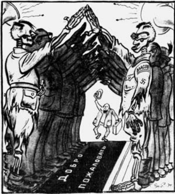
«Триумфальная арка для господина Солженицына».