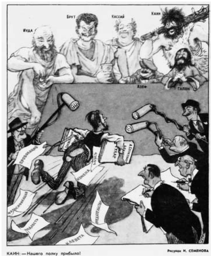
Карикатура журнала «Крокодил», №7, 1974 г.

Вечер того же дня он проводит в сельском домике Генриха Бёлля под Кельном.