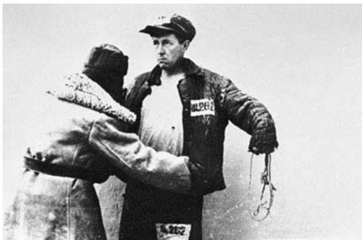
Постановочное фото «Обыск на проходе». В роли зека – Александр Солженицын

Вот он в казахстанской ссылке – взгляд пронизывающий, слегка из-под бровей, вымученная складка на лбу символизирует мудрость, пришедшую с нелегким опытом.