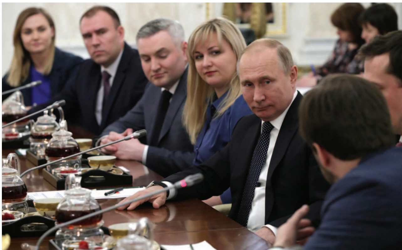
Встреча с победителями конкурса «Лидеры России». 19 марта 2019 г.

Уже сегодня на смену современной элите готовится новое поколение эффективных управленцев. Для их поиска по всей стране был организован конкурс «Лидеры России», в начале его первого этапа объявил в октябре 2017 г. Сергей Кириенко. Конкурс, основанный на объективных критериях, может пройти любой молодой человек из любого уголка страны.