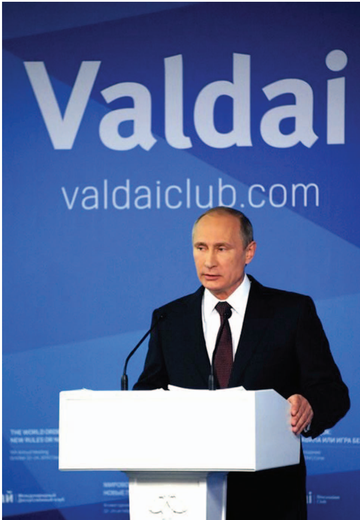
Заседание Международного дискуссионного клуба «Валдай», 24 октября 2014 г.