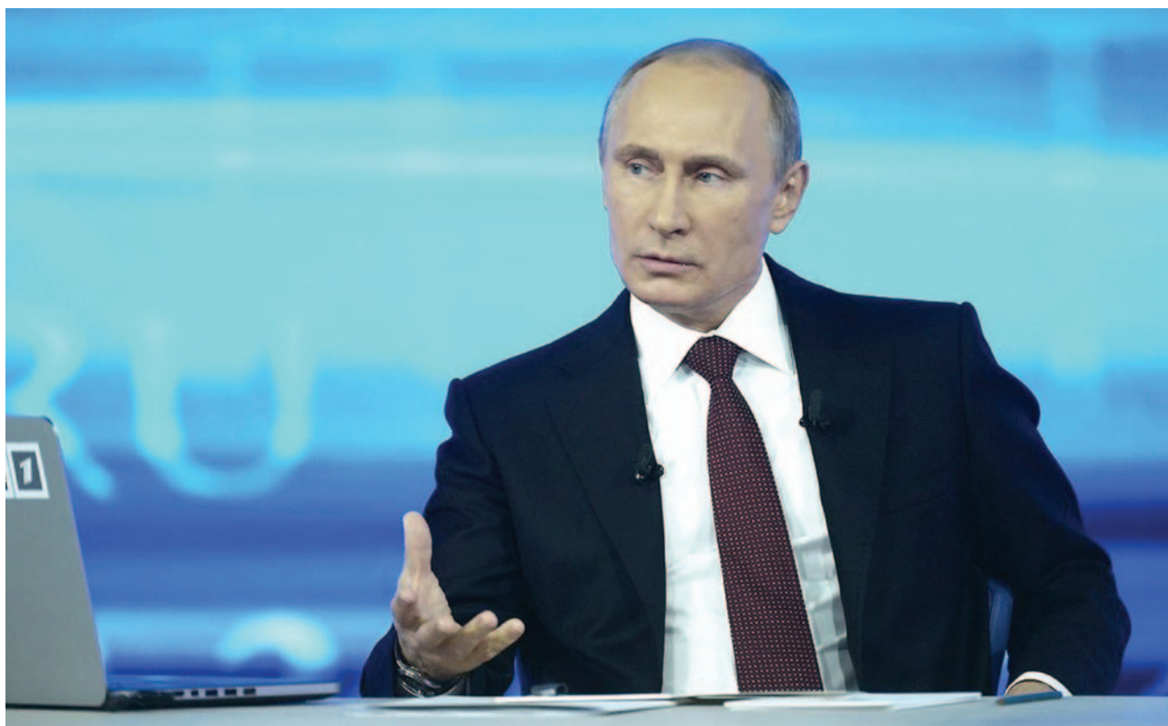
«Прямая линия с Владимиром Путиным», 17 апреля 2014 г.

Для Запада «чекистское» прошлое Путина быстро стало его определяющей характеристикой – конечно, в негативном ключе, у всех в памяти еще были свежи карикатуры с устрашающим железным спрутом, оснащенным подписью: “KGB”. Однако, возможно, именно Путину удалось лишить это слово пугающих коннотаций, напомнив, что дело разведчика – это, прежде всего, беззаветная служба Родине.