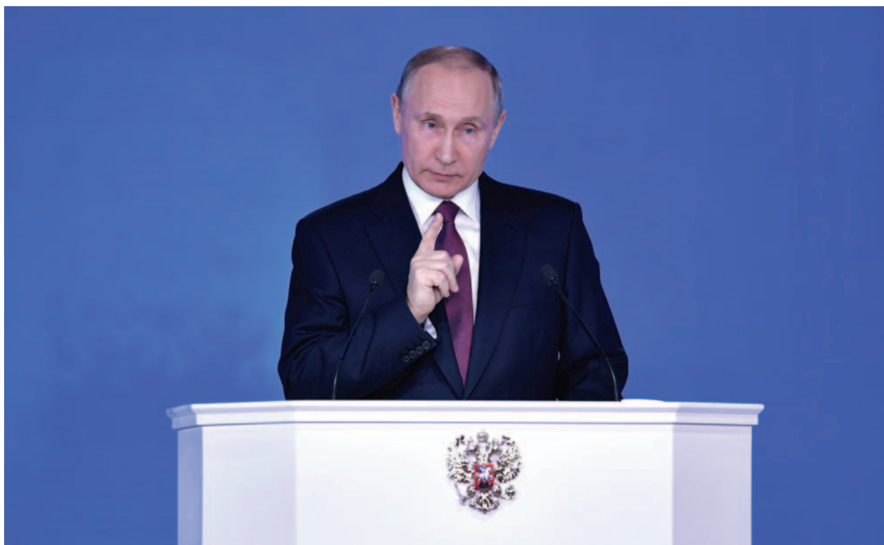
Владимир Путин обращается с ежегодным посланием к Федеральному Собранию Российской Федерации, 1 марта 2018 г.

Новая Россия, которую строит Путин, не станет империей ни в романовском, ни в советском виде. Ее предназначение – не стоять над всеми, но, возможно, быть катехоном – последним бастионом, удерживающим мир.